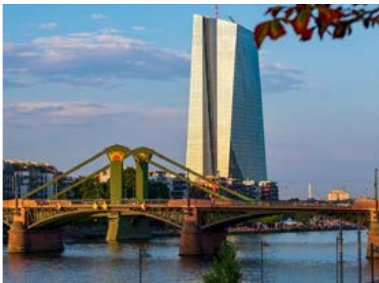
Francoforte sul Meno, Banca Centrale Europea

Le previsioni sull'andamento del tasso dei mutui fissi sono più complicate in quanto l'Eurirs ha un legame più stretto con gli strumenti obbligazionari di pari durata come il Bund tedesco, storicamente considerato il benchmark più affidabile a livello europeo. Inoltre, gli indici Eurirs si basano anche sulle stime sull'inflazione dell'Eurozona.